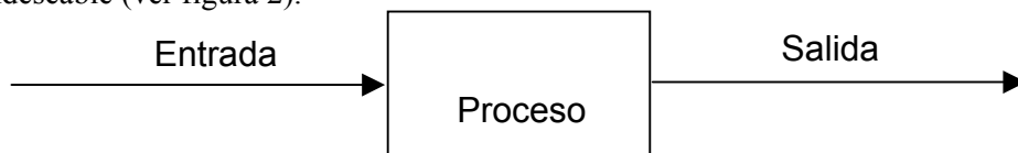
Figura 1. Diagrama EPS de un sistema.

Por ejemplo, el sistema digestivo avisa la necesidad de alimento que deberá ingerir el usuario cuando se requiere energía y nutrientes esenciales. Una vez se ingresa la cantidad de alimento, el organismo se encarga de realizar el proceso de digestión, dando como resultado, la absorción de los nutrientes esenciales y el desecho del material indeseable (ver figura 2).